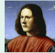
Portrait d'homme, par Piero di Cosimo, vers 1500, Londres, galerie Dulwich

Chef de file du mouvement « Fauve », Matisse explore différentes techniques picturales avant de vouer son art à la couleur pure. Cet artiste prolifique produira également de nombreuses sculptures qui traduisent sa démarche de simplification pour donner une force nouvelle aux volumes.