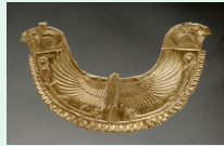
Collier phénicien en or, vers - 1700

Rassemblant des objets ou des matériaux, aliments, vaisselle, fleurs ou fruits, la nature morte est un genre pictural qui offre un rendu fidèle des matières et textures, et réveille nos sens, en abordant des thématiques parfois plus symboliques.