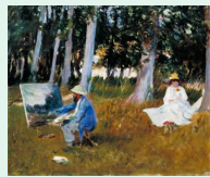
John Sargent « Claude Monet painting by the edge of wood » huile sur toile, 1885, Tate Gallery

Les parures antiques de plusieurs civilisations de l'antiquité : matières précieuses, objets symboliques et de prestige, portés par les souverains et les membres de l'aristocratie, parfois supports de croyances et de vertus magiques, les bijoux remplissent aussi des rôles de protection, de guérison ou d'accompagnement vers l'au-delà.