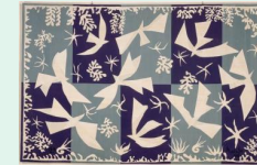
« Polynésie », 1946, par Henri Matisse musée de Troyes

Immersion dans l'univers de l'art textile : la tapisserie avec l'analyse de diverses tentures du Moyen Âge jusqu'à la Renaissance. Nous décodons les thèmes représentés à l'époque qui ornent les murs des châteaux.