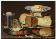
peinture à l'huile, Clara Peters, vers 1600, county museum, Los Angeles

Voyage dans l'art protohistorique avec des stèles antropomorphes, dites statues-menhirs ou des gravures d'époque néolithique et de l'âge du bronze, dont la vocation est toujours un sujet de recherches pour les archéologues.